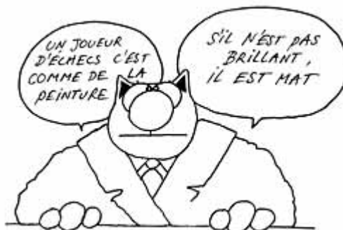
Dessin de Philippe Geluck

« Il existe une science dont le but est l'étude de l'acoustique et des sons. Mais il y a aussi un art qui se sert de l'océan des sons : c'est la musique. De toute évidence, il en est de même pour la pensée. La logique est l'étude des lois de la réflexion et les échecs reflètent, en tant qu'art, le côté logique de la réflexion, sous la forme d'images artistiques... » Michail Botvinnik